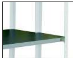
СТ-012 Полка 300x1000